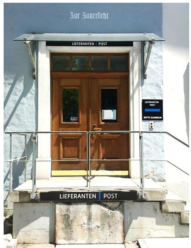
Lieferanten-Post-Eingang im Haus „Zur Zuversicht“

Kirche war schon immer eine Hoffnungsinstitution. Ist sie das nicht mehr, verliert sie ihr Eigentliches. Haus „Zur Zuversicht“ könnte eigentlich an jedem Kirchengebäude angeschrieben stehen, und nicht nur am Lieferanten-Eingang (wenn auch da ganz besonders!)